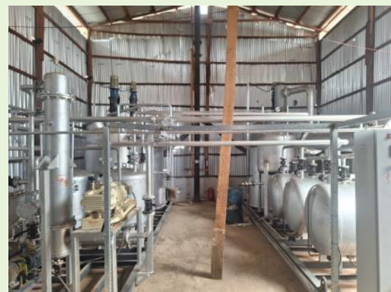
Traitement des huiles usagées (AB-Investment)