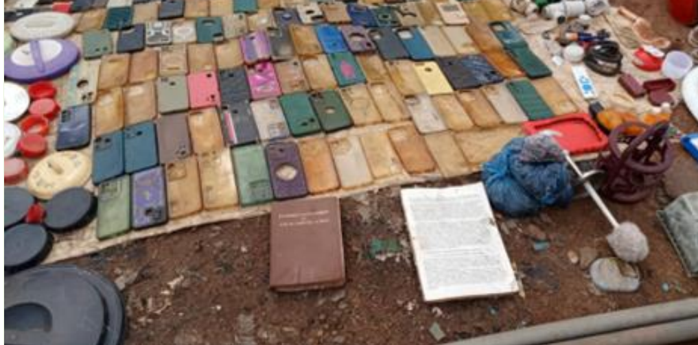
Récupération informelle sur le site d'une décharge de Bangui