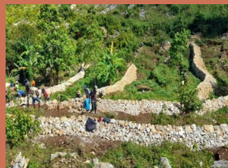
Cordons pierreux et agroforesterie sur les bassins versants