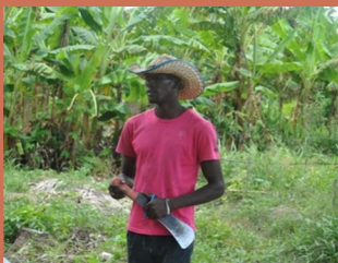
Champs écoles paysans dans périmètres irrigués