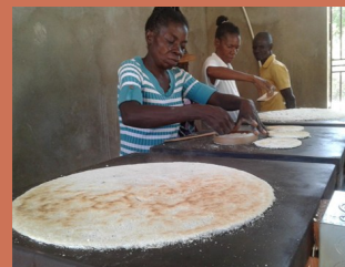
Appui aux unités de transformation