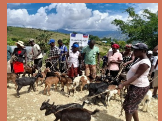
Promotion de l'élevage caprin