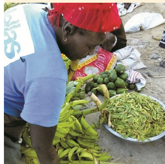
Vendeuse de productions locales sur le marché de Gros Morne