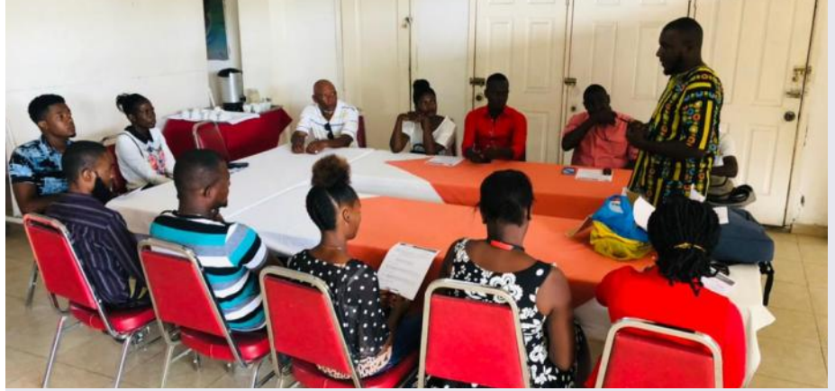
Échanges avec des jeunes du quartier de Turgeau