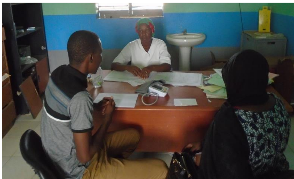
Visite d'un poste de santé par l'équipe du Gret pour dresser un état des lieux de la structure