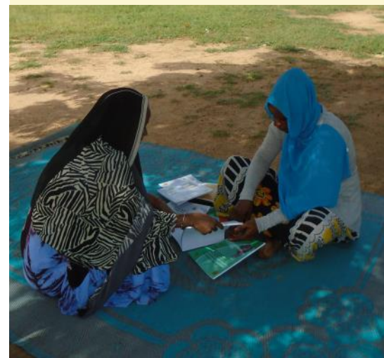
Session de travail entre la superviseuse du GRET et une relais communautaire