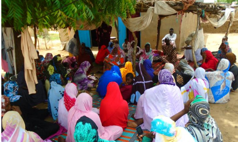
Session de dialogue communautaire regroupant les femmes du village et leur entourage