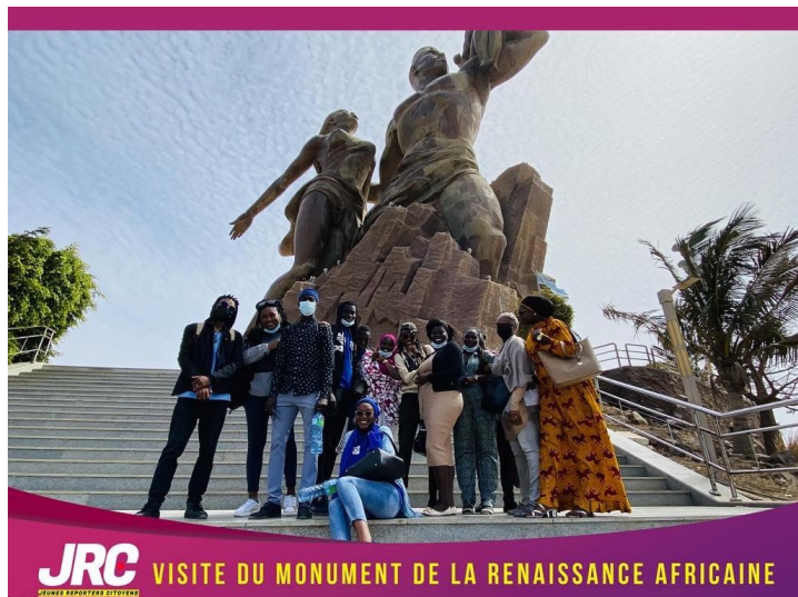
JRC VISITE DU MONUMENT DE LA RENAISSANCE AFRICAINE

La présente publication a été élaborée avec l'aide de l'Agence française de développement (AFD). Le contenu de la publication relève de la seule responsabilité du Gret et ne peut aucunement être considéré comme reflétant le point de vue de l'AFD.