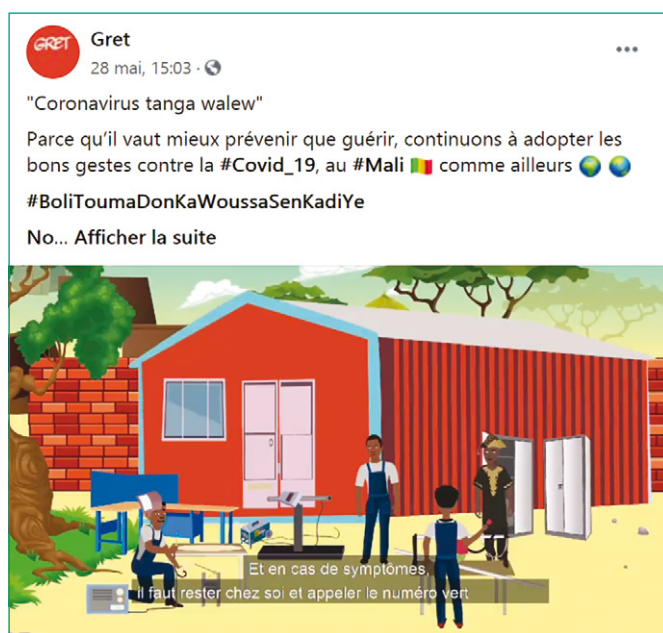
↑ POST FACEBOOK REPRENANT LA VIDÉO MALI

Au Mali, dans le cadre du projet Imyeta financé par la coopération norvégienne (Norad), une vidéo animée de sensibilisation en langue bambara a été réalisée avec l'accord du ministère de la Santé malien. Cette vidéo, diffusée au sein des ateliers partenaires du projet, permet de sensibiliser les artisan-ne-s et leurs apprenti-e-s aux gestes barrières mais également les membres des villages reculés via le partage sur les réseaux de messagerie. Cette vidéo a été reprise par le ministère malien de la Santé à qui le Gret a cédé les droits et sera traduite dans une dizaine de langues. ●