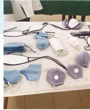
↑ FORMATION DE LA BRIGADE DE SENSIBILISATION COVID-19 DANS LES MARCHÉS DE PORT-AU-PRINCE, HAÏTI