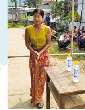
← DES STATIONS DE LAVAGE DES MAINS À L'ENTRÉE DE LA ZONE DE DISTRIBUTION, MYANMAR

Au Burkina Faso , le service AlloLaafia , financé par l'Agence française de développement (AFD), la Fondation Bel et l' Unicef , s'est adapté pour lutter contre le Covid-19. Ce service fournit des conseils par SMS aux familles de Ouagadougou et des régions de l'Est en matière de santé maternelle et infantile. Depuis quelques semaines, les messages ont été complétés par des SMS centrés sur la lutte contre le Covid-19 : son origine, l'état des lieux, les populations à risque, les gestes barrières, le comportement à adopter en cas de suspicion de contamination. Une cinquantaine de SMS, validés par le ministère de la Santé du Burkina Faso , ont ainsi été envoyés à 10 800 personnes.