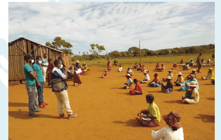
↑ SÉANCE DE SENSIBILISATION DANS LE FOKONTANY MAROPIA, MADAGASCAR

Au Niger , avec le soutien de la coopération monégasque , un diagnostic d'identification des besoins locaux a été réalisé en partenariat avec l'État, les partenaires urgentistes ainsi qu'avec les responsables des unités de production d'aliments fortifiés. Au total, 10 équipements de désinfection ont été mis en place, 195 cartons de savon, 6 000 masques et 22 cartons de gel hydroalcoolique ont été distribués sur cinq zones d'intervention (Matamey, Tessaoua, Chadakori, Danja et Niamey).