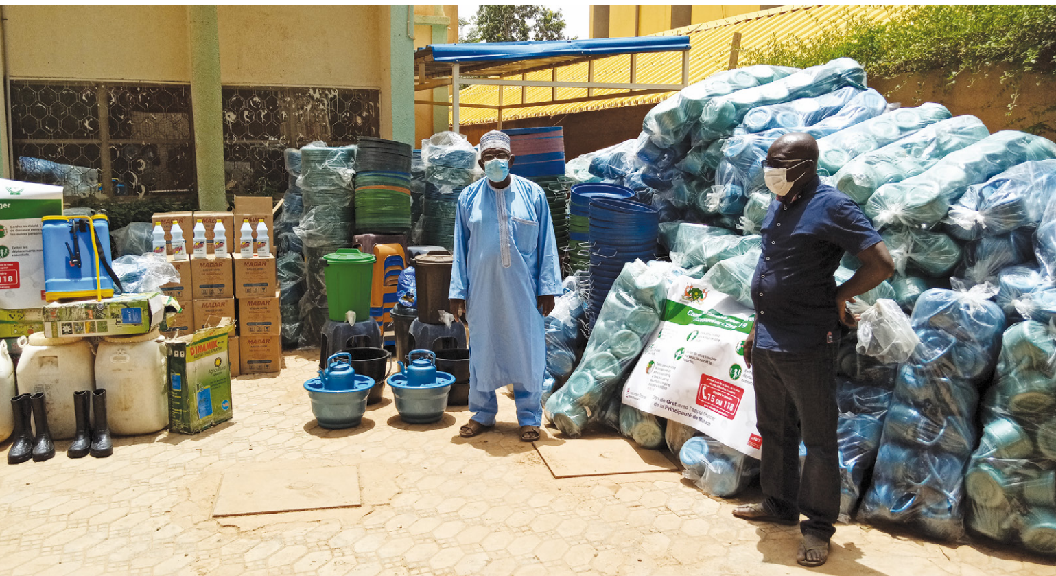
↑ RÉCEPTION DE MATÉRIEL D'HYGIÈNE AU NIGER