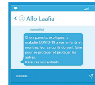
↑ EXEMPLE DE SMS REÇU PAR LES POPULATIONS, BURKINA FASO