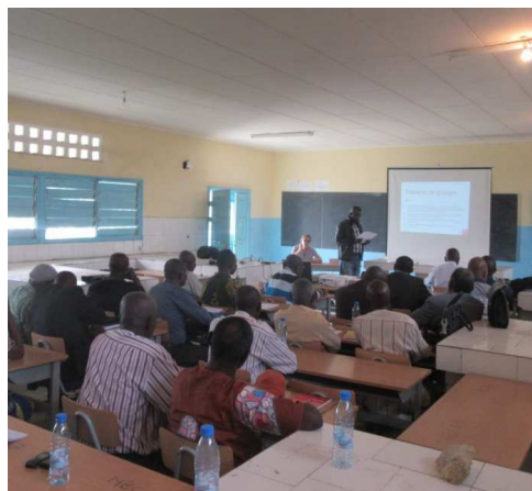
L'atelier de mise à jour des données à Mfilou, le 29 juin 2017