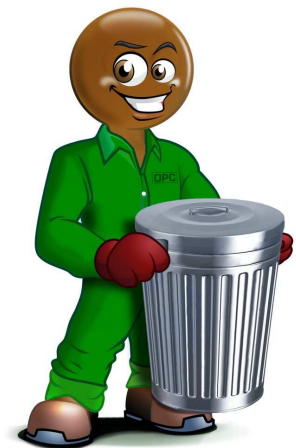
La mascotte du service de pré-collecte qui sera utilisée sur tous les supports de marketing du service

Dans la continuité des accompagnements sur le développement des activités, un dispositif d'aide au remplissage du formulaire, a été déroulé pour accompagner les OPC. Constitué de six séquences d'accompagnement, il a permis aux OPC de préciser le problème à résoudre, les effets que pourront engendrer l'acquisition de l'équipement, les modalités d'entretien/renouvellement de l'équipement et définir un plan d'épargne en fonction du montant de la contrepartie. Les 23 OPC ont été accompagnés chacun au moins quatre fois dans ce processus car au regard de la cible, l'accompagnement devrait se faire au pas à pas.