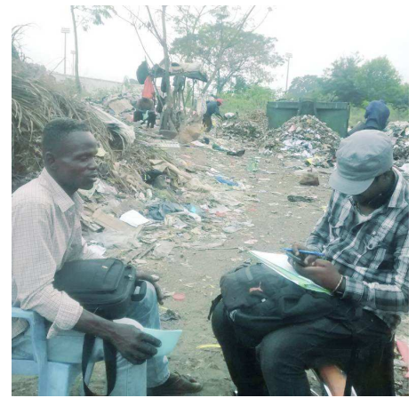
Une session d'accompagnement individuel sur la gestion financière des activités

Contact au siège : Adeline Pierrat / pierrat@gret.org