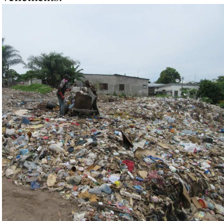
Le ravin de la rue Malima à Djiri

Au 31 juillet 2017, le nombre d'autorisations délivrées est de 96, la barre des 100 est proche ! A Talangaï, où le dispositif a été lancé en mars 2017, a vu la délivrance de 17 autorisations entre mai et juillet 2017. Baongo et Makélékélé enregistrent des taux de renouvellement importants, stimulés par le fonds d'équipement (les OPC devaient avoir une autorisation en cours de validité pour déposer une demande). A Moundali, la réorganisation de la Cellule d'Exécution Communale semble impacter sur les nouvelles demandes et les renouvellements.