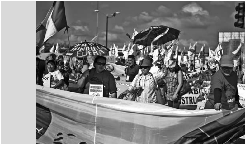
Manifestation de la société civile à Cancun.