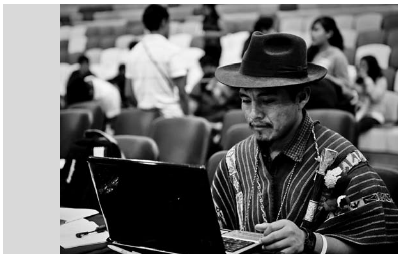
Un participant à la réunion des groupes de peuples autochtones à Cancun.