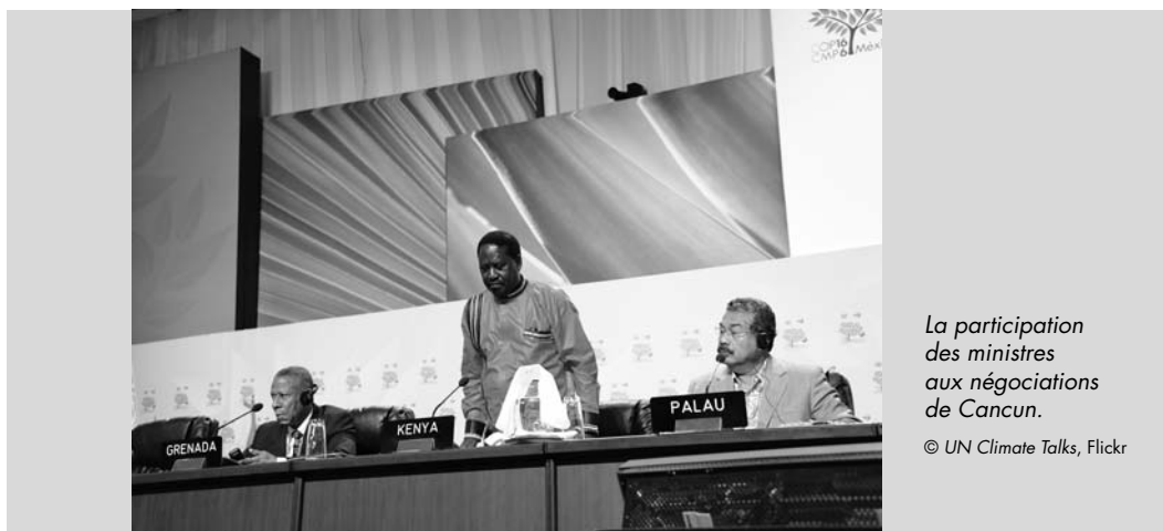
La participation des ministres aux négociations de Cancun.