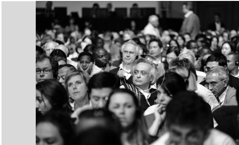
Le ministre indien de l'Environnement Jairman Ramesh.

Les prises de position du ministre indien de l'Environnement, Jairman Ramesh, et ses propositions dans les négociations sont apparues volontaires et progressistes, en particulier celle concernant le système de « Mesure, de notification et de vérification » ( Mesuring Reporting and Verifying – MRV ) des actions mises en œuvre unilatéralement par les pays en développement. Cette proposition a permis d'atteindre un compromis et d'apaiser la relation entre la Chine et les États-Unis 5 .