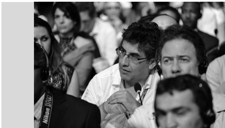
Pablo Solon, ambassadeur bolivien en charge des négociations sur le climat.