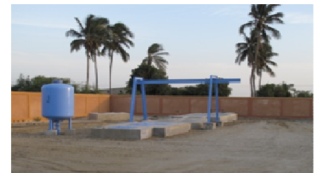
Station de pompage des eaux usées exploitées par l'ONAS à Saint-Louis