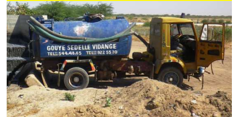
Dépotage d'eaux usées par un camion vidangeur privé dans la station de traitement de Saint-Louis

Associé au projet dès sa conception, l'ONAS a désormais officiellement rejoint les partenaires d'Acting par la signature d'une convention. Les équipes de l'ONAS participeront au suivi des études techniques et au contrôle des travaux, à la mise à jour du Plan Directeur d'Assainissement de Saint-Louis ou encore au renforcement des vidangeurs.