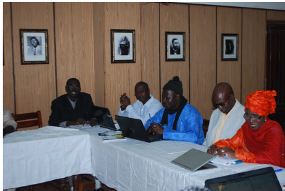
Réunion du cadre de concertation pour l'assainissement

Après un rappel des termes de références du cadre de concertation par l'ADC, le chef de l'Antenne Nord de l'ONAS a dressé un état des lieux de l'assainissement à Saint-Louis. Le Gret et l'ADC ont présenté les projets en cours dans les quartiers de Guet Ndar, Diamaguène et Ndiolofène.