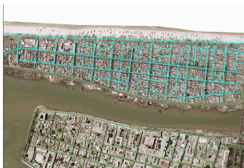
Schéma du futur réseau d'assainissement de Guet Ndar

Une étude d'impact environnementale sera aussi réalisée conformément à la réglementation en vigueur.