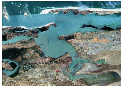
Vue du territoire de la commune de Saint-Louis et de la station de traitement des eaux de Gandiol