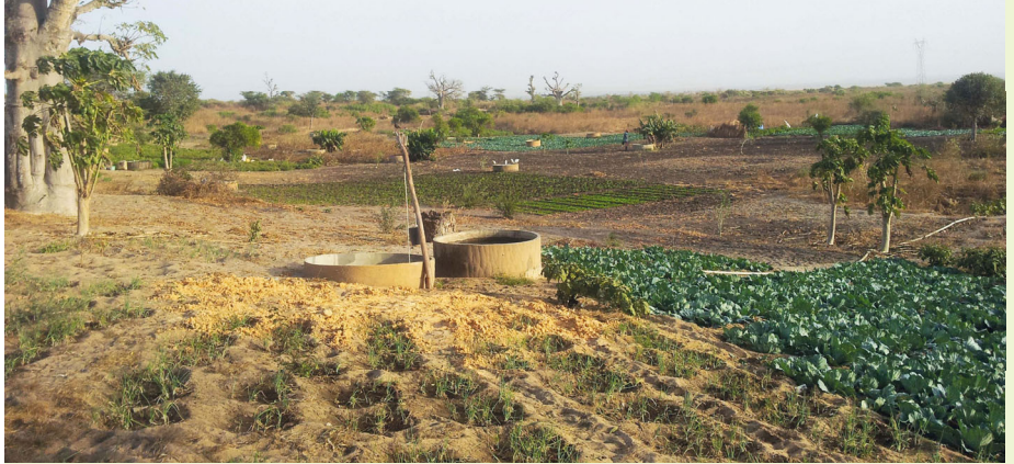
Maraichage dans la zone des Niayes