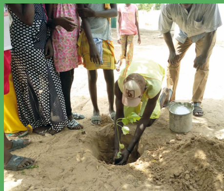
À Diender Kayar, la plateforme reboise