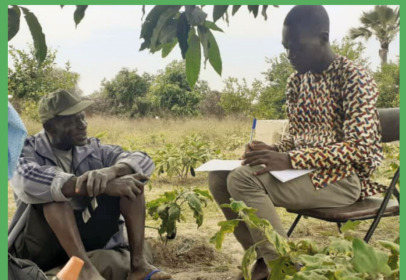
Entretien avec un agriculteur, membre d'une plateforme