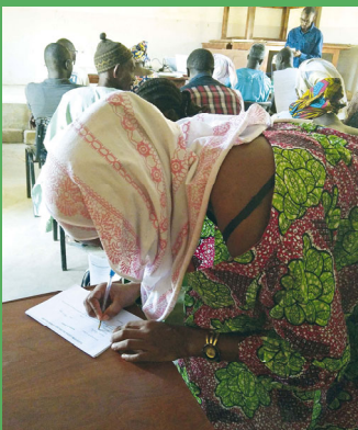
Une femme adhère à une Plateforme locale de l'eau