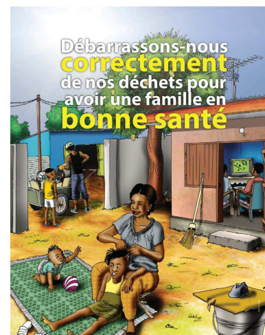
Supports utilisant pour les Visites à Domicile dans le cadre de la réalisation des activités d'IEC