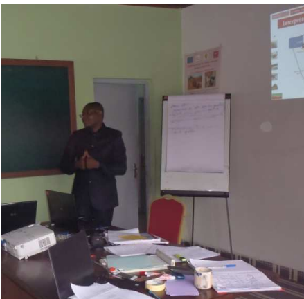
Animation par le DEPV d'une session de la formation des autorités locales aux autorisations

Se protéger des risques sanitaires n'attend pas ! La formation des OPC sur ce sujet a eu lieu le 13 juillet à Moundali, après avoir été menée dans deux autres arrondissements.