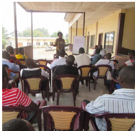
Participants à la réunion de concertation entre les acteurs des de la gestion des déchets à