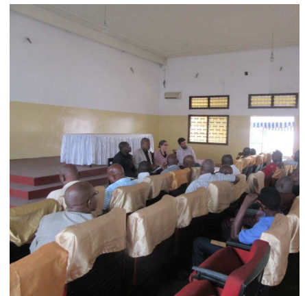
Réunion de concertation sur les solutions de regroupement à Ouenzé