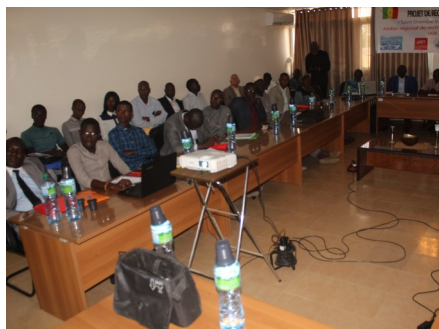
Atelier régional de restitution à l'UGB

Ce moment a permis aussi de soulever des questions importantes pour l'atteinte des objectifs de développement durable (ODD 6.B) dont l'implication de la société civile. Les propositions de dispositifs de représentation d'usagers et de dialogue multi-acteurs ont été largement partagées et discutées pour garantir une transparence dans la délivrance du service public de l'eau milieu rural. Concernant la question des échelles territoriales les plus pertinentes pour la concertation, le niveau communal et régional ont été retenus en raison de l'animation de cadres communaux par les mairies et de l'existence du cadre de concertation régional sur l'eau et l'assainissement (CCREA).