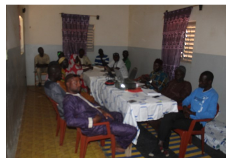
Réunion des Unions à Ndiatène

Un atelier a été organisée à la Direction de la gestion et de la planification des ressources en eau (DGPRE) en février dernier pour échanger sur les questions de Gire territoriale. Cet atelier était l'occasion pour les participants du projet SENSE de connaître les trois projets de Gire en cours au Sénégal. Les retours d'expériences ont concerné la mobilisation des acteurs, la représentation des acteurs, les dispositifs de concertation multi-acteurs tels que les plateformes locales de l'eau (PLE) et les stratégies de pérennisation des actions.