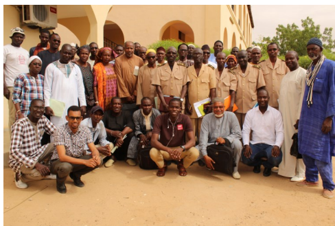
Atelier départemental de Podor