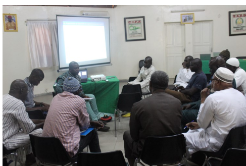
Travail de groupe atelier Gorom-Lampsar