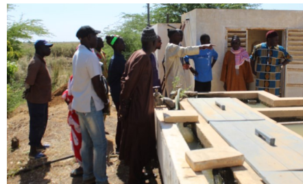
Rencontre avec l'union départementale de Dagana

La capitalisation est le dernier volet de ce projet mais elle en constitue sans doute le plus important puisque la recherche-action est une expérimentation à analyser, améliorer et partager. Ce travail a démarré depuis juillet 2018 à travers une analyse croisée entre les résultats des études menées dans le cadre du projet SENSE et les expériences de régulation en contexte de délégation de service public de part le monde. Les documents finaux comprendront un rapport de synthèse des études réalisées sur les dispositifs de représentation et de dialogue et un rapport de capitalisation intégrant la question de la régulation locale des services d'eau et du rôle des usagers dans cette fonction.