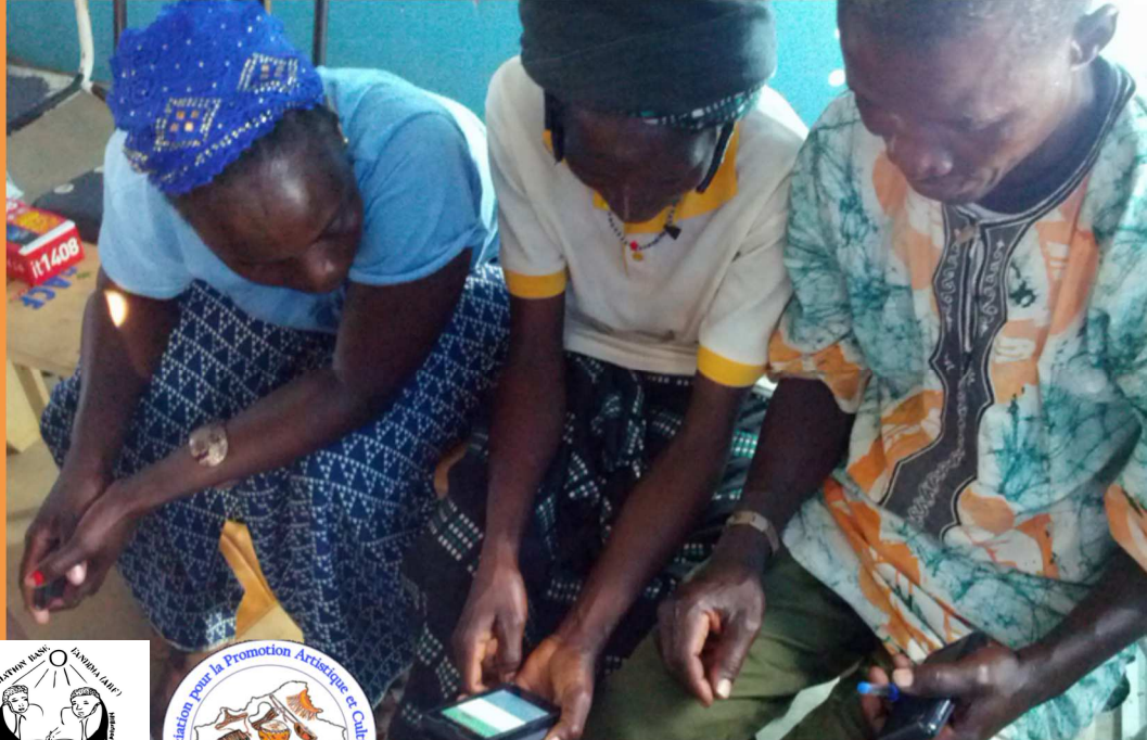
Formation des agents de santé à la PCIMA électronique