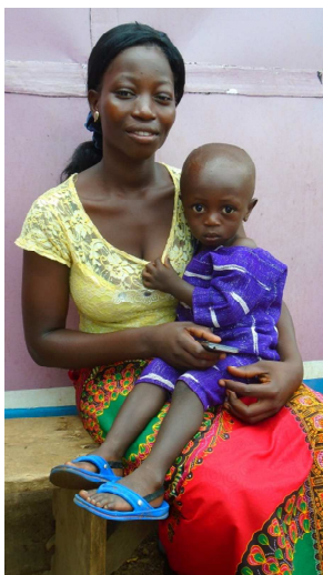
Abonnée AlloLaafia