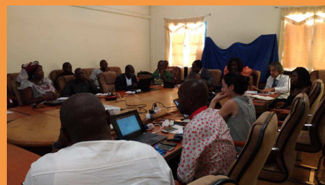
3ème cadre de concertation TIC et Santé

Le cadre de concertation des acteurs TIC et Santé a pour vocation de faciliter la coordination des interventions sur le territoire burkinabè à travers des échanges sur les différents projets en cours au Burkina, la mise en place d'un répertoire d'initiatives et des débats et discussions autour des différents enjeux des TIC appliqués à la santé..