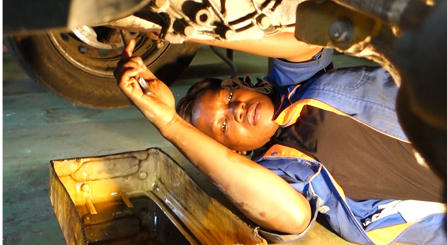
Mise en situation d'une apprentie en mécanique automobile pour la réalisation des contenus dématérialisés