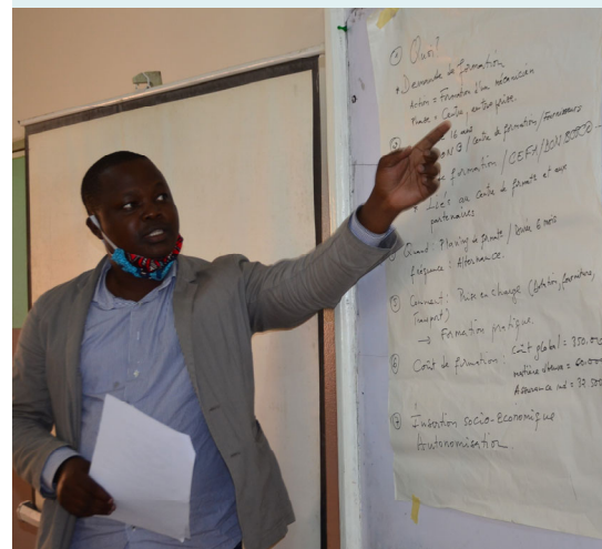
Atelier d'échange de pratiques sur l'accueil, l'écoute et l'orientation des personnes en situation de vulnérabilité