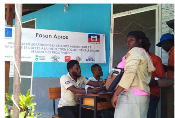
Distribution des coupons Alimentaires à Source Beauvoir, 2ème Section Chansolme