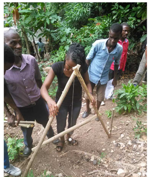
Activités de protection des versants : Formation des chefs d'équipe, des contrôleurs et superviseurs, 3eme section de Gros-Morne

R3 : Un dispositif de protection sociale basé sur l'accès à l'offre alimentaire locale et le développement d'activités économiques est mis en place pour appuyer les ménages touchés par l'insécurité alimentaire chronique