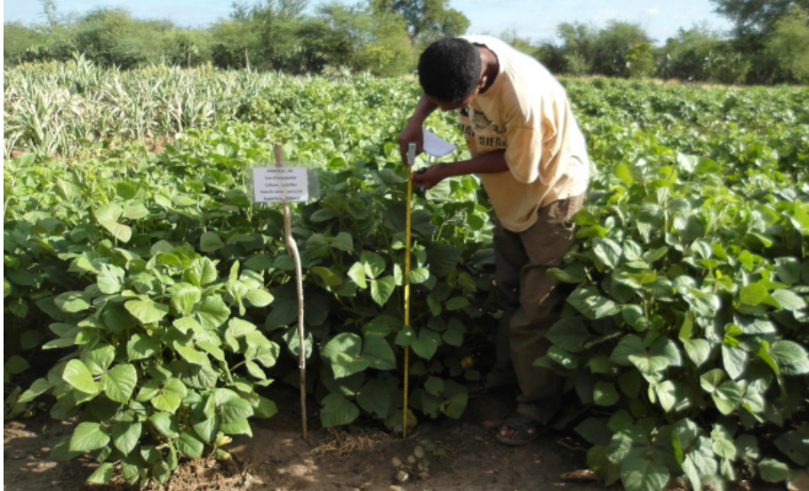
Parcelle de caractérisation d'Antsoroko au Centre de production de semences d'Agnarafaly