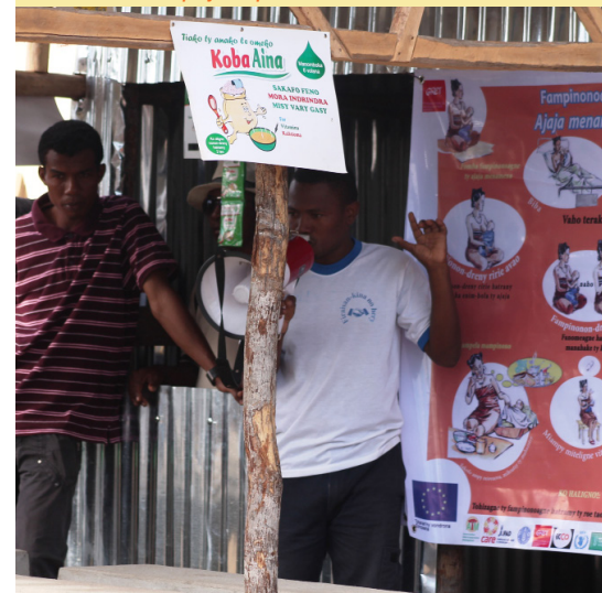
Un animateur du projet en pleine action de sensibilisation