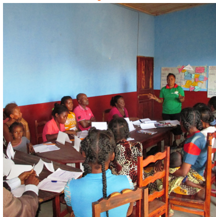
Séance de formation des agents communautaires

Il est piloté par la FAO et est mené en consortium avec sept organisations : Pam, Fida, Gret, Care, AIM, Icco et WHH. Le projet permettra d'augmenter la diversification de la production agricole vivrière, de sécuriser la disponibilité et l'accessibilité alimentaires des ménages les plus vulnérables ciblés, et d'améliorer les pratiques nutritionnelles et d'hygiène.