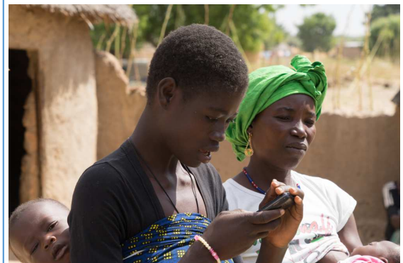
Séance de lecture d'un message AlloLaafia à Diabo