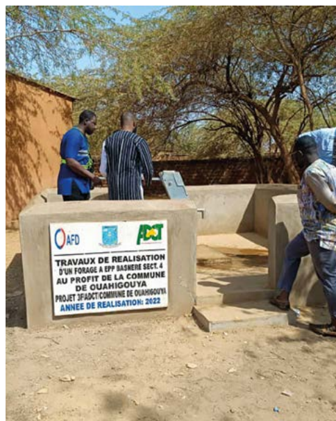
Forage réalisé à Ouahigouya dans le cadre du projet 3 frontières.

« Nos équipes travaillent en formulant des projets à partir des besoins exprimés par les populations et les acteurs communautaires. Notre mode d'intervention vise à faire participer et à responsabiliser les communautés. Ainsi, nous garantissons une plus grande efficacité et un renforcement des pouvoirs des collectivités locales. Nos projets sont conçus et mis en œuvre dans l'objectif d'impacter positivement et durablement les populations locales et d'influer sur les politiques publiques. »