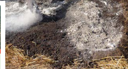
Accompagnement des agriculteur-riche-s dans le processus de compostage.