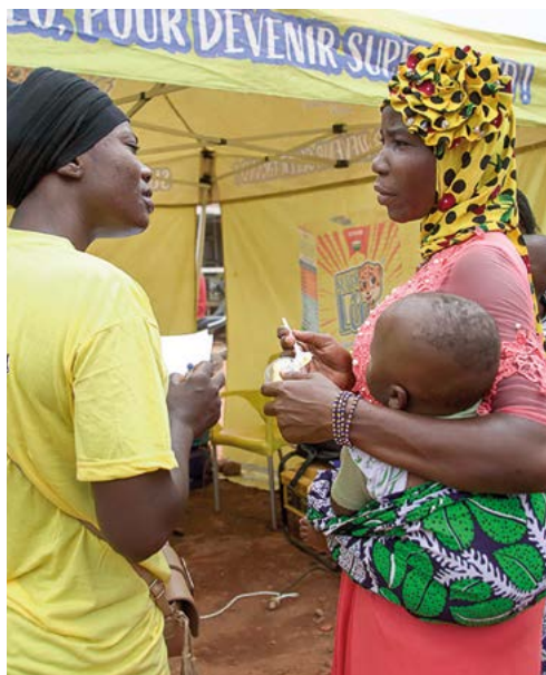
Séance de dégustation de la farine super Léo dans les quartiers de Ouagadougou.