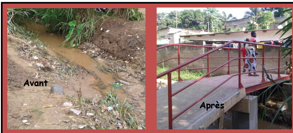
Situation de la zone d'intervention du projet de construction d'une passerelle dans le quartier 108 à Makélékélé avant et après la réalisation du projet

LOUMOUAMOU Clotaire (Chef du quartier 26 à Baongo) : « la construction du caniveau suscite une satisfaction de tous. Par exemple, la mosquée n'avait pas d'évacuation des eaux usées; ce projet vient régler non seulement le problème du quartier mais aussi le leur. »