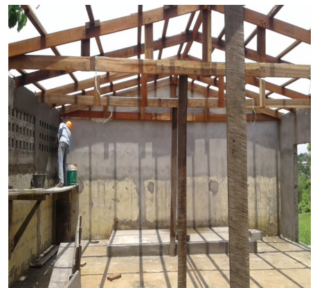
Réhabilitation du siège de quartier Ngassa à Makélékélé