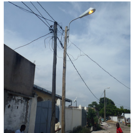
Projet d'électrification de l'avenue Mayoma à Makélékélé

CONTACT : Représentation du Gret au Congo